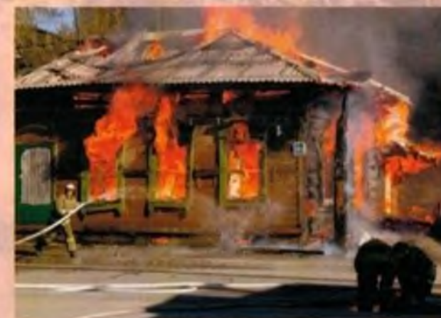
В этом доме в поселке "Ударник" Ангарского района 2 января 2014 г. при пожаре погибли трое детей.